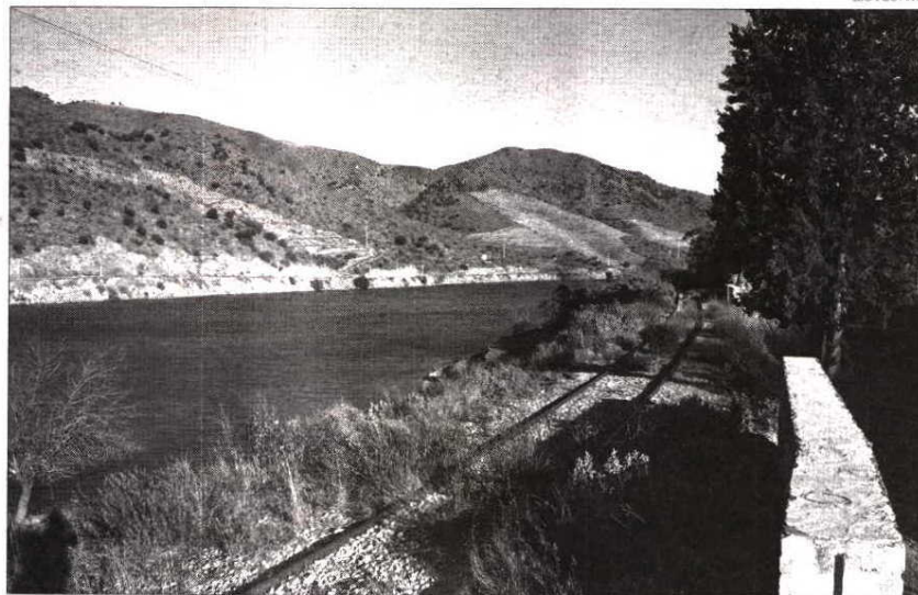
Sem comboios desde 1988, a linha deverá acolher as carruagens que são peça importante no puzzle turístico